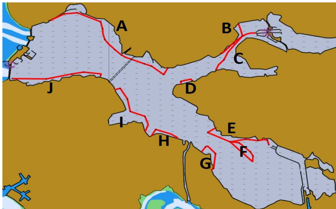
Figuur 1. begrenzing (in rood) van kreeftenlocaties waar gedurende 1 februari tot en met de eerste maandag van maart geen vaste vistuigen mogen worden geplaatst. (Aan deze afbeelding kunnen geen rechten worden ontleend)